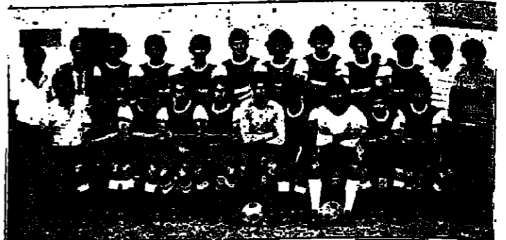
فريق هيو عييل كفر قاسم يحل المرتبة الثالثة لفرق الدرجة الثانية في المنطقة الجنوبية (أ) وصيدته ست نقاط والفرق بينه وبين المرتبة الاولى نقطة واحدة فقط ..

تنتهي لجميع المشتركين في المسابقة النجاح والفرح بالجوائز المالية .. ويقولون ان الجائزة الاولى ستصل الى ٦٠٠ الف شيك ..